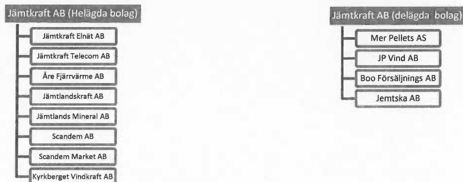
Bild 1. Jämtkrafts helägda samt delägda bolag

I koncernen Jämtkraft finns tolv bolag (se bild 1), varav det ena är Jämtkraft Elnät AB. Jämtkraft Elnät AB har ca 60 000 elnät kunder och omfattas därmed inte av Ellagen 3 kap 1 b § om separata styrelser, vd/firmatecknare i elnätbolaget resp. elhandelsbolaget. All produktion och elhandel bedrivs i moderbolaget.