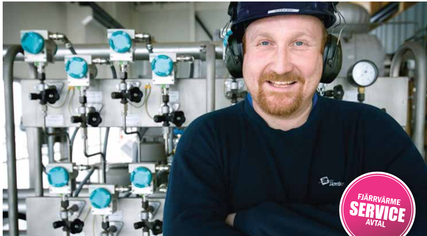
När du tecknar ett serviceavtal undersöker och servar vi din fjärrvärmecentral regelbundet, för att den ska vara rätt justerad och få längre livslängd.