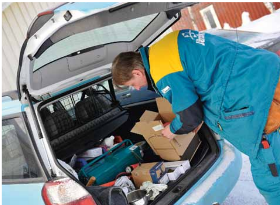
Arbetet med installation av fjärravläsning pågår just nu för fullt.

Jämtkraft innehar kvalitetsmärknings Reko fjärrvärme. Reko är fjärrvärmebranschens egen kvalitetsmärkning för goda kundrelationer.