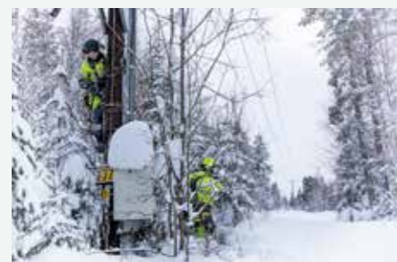
Arbetet med vinterns återställningsarbete under det omfattande snöfallet i januari. Endast 75 fel upptäcktes på Jämtkraft Elnäts luftledningar. Det var saker som behövde åtgärdas, men som – tack vare vädersäkringsarbetet – i de flesta fall inte orsakade strömavbrott.

Som elanvändare har du rätt till såväl avbrottsersättning som skadestånd enligt ellagen. För att du ska kunna få avbrottsersättning utbetald, måste strömavbrottet ha pågått sammanhängande i minst 12 timmar. När elen återigen fungerat oavbrutet i minst två sammanhängande timmar anses avbrottet ha upphört.